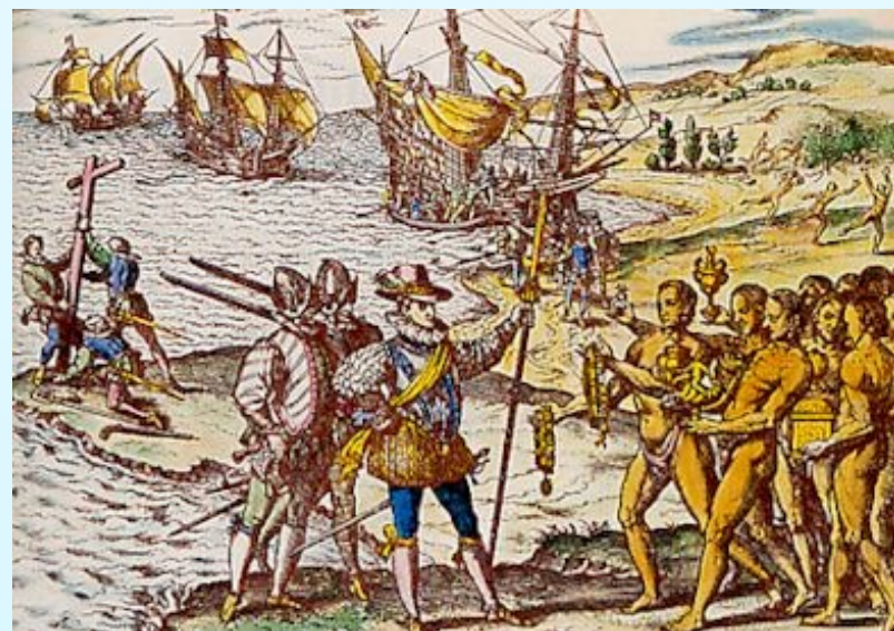
Colomb rencontre les 1ers « Indiens » d'Amérique

A sa suite, les Portugais s'installent en Amérique du Sud et les Français en Amérique du Nord.